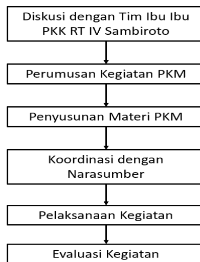
Gambar 1 Mekanisme Kegiatan

Implementasi kegiatan pengabdian diawali dengan membuka komunikasi dengan Kelompok Ibu Ibu PKK RT 4 Kelurahan Sambiroto untuk memperlancar jalannya kegiatan. Hal ini dapat dilihat pada Gambar 1.