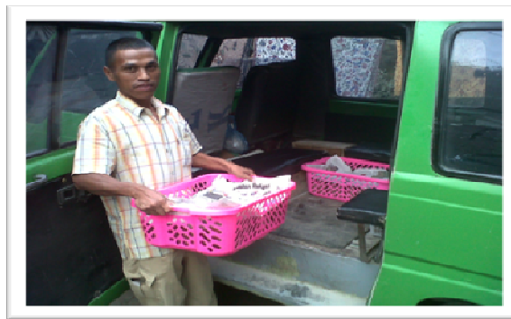
Gambar 2. Jajanan Tradisional dan Pelanggan jajanan