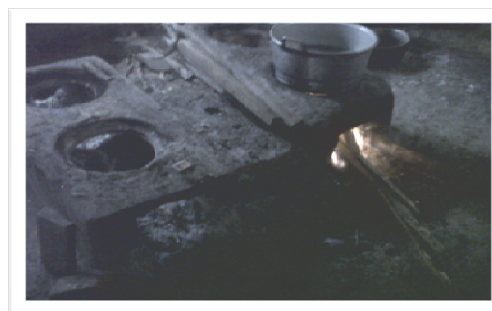
Gambar 1. Kayu bakar dan Tungku luweng