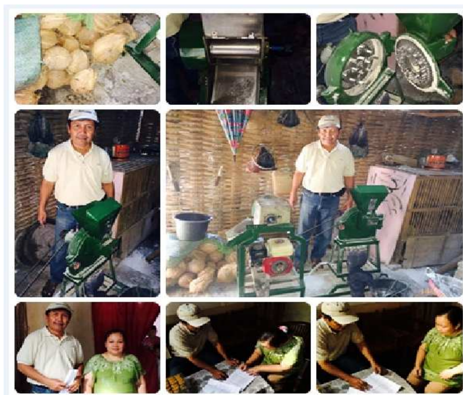
Gambar 4. Luaran Kegiatan Pengabdian kepada Masyarakat