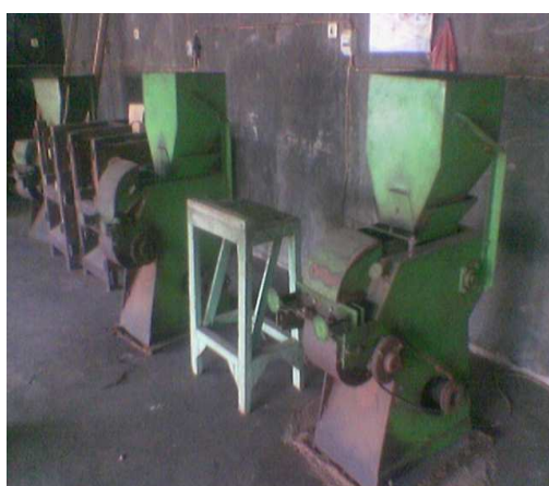
Gambar 8. Mesin Giling Tembakau