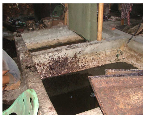
Gambar 12. Bak Pengolahan Limbah diterapkan oleh industri