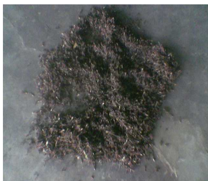
Gambar 3. Gagang Cengkeh di Jemur