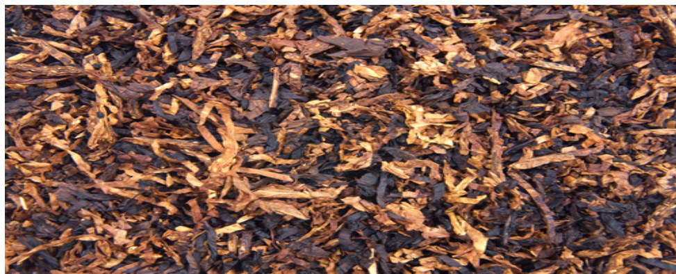
Gambar 10. Tembakau Siap Pakai