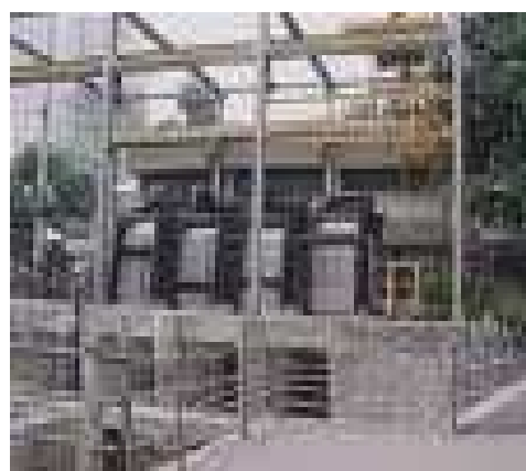
Gambar 14. Filterisasi 1