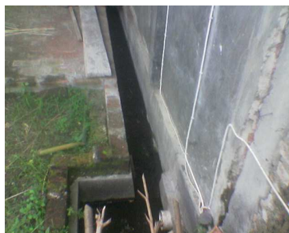
Gambar 16. Got Pembuangan Limbah