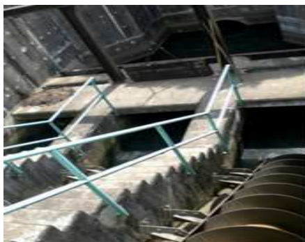
Gambar 15. Filterisasi 2