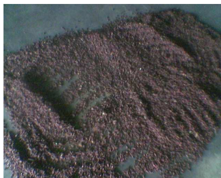
Gambar 2. Cengkeh di jemur