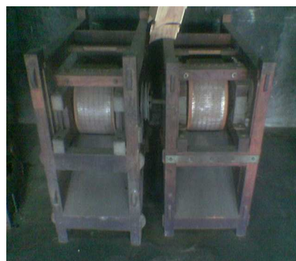
Gambar 4. Mesin Giling Cengkeh