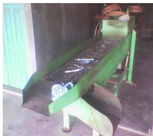
Gambar 9. Mesin Ayak Tembakau