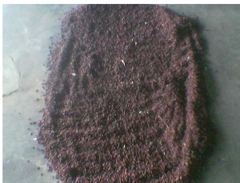
Gambar 1. Cengkeh Setelah Direndam