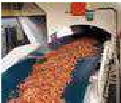
Gambar 6. Tembakau Setelah di Rendam