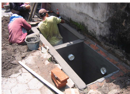
Gambar 11. Pembuatan Bak-Bak Pengolahan Limbah