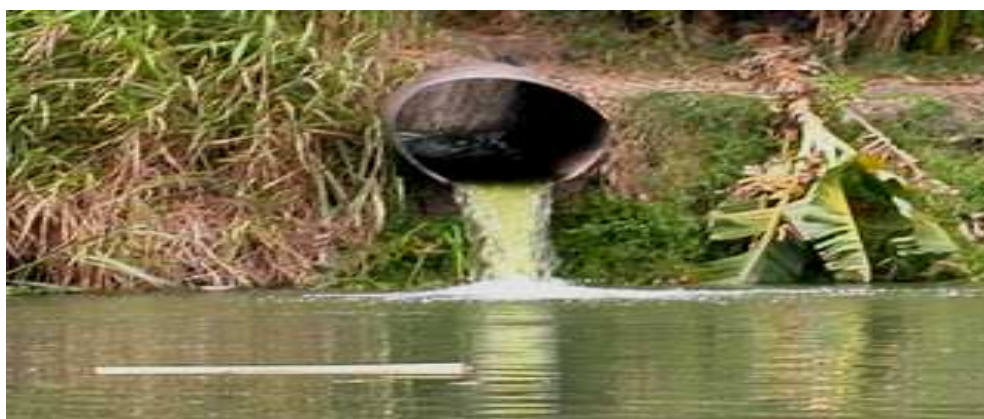
Gambar 17. Limbah Steril ke Sungai